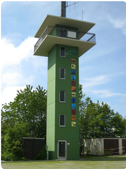
Der neu gestaltete Aussichtsturm

Um die Erreichbarkeit des Aussichtsturms für Touristen zu verbessern, wurde zudem die Fläche vor dem Turm als Parkplatz befestigt. Die großen Pfützen, die sich stets nach Regen bildeten und die Nutzung des Parkplatzes auch noch Tage später einschränkten, gehören damit der Vergangenheit ein. Wanderern steht nun ein Parkplatz zur Verfügung, der wetterunabhängig nutzbar ist.