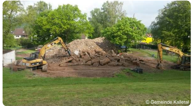
Die Bagger schaffen Platz für das Multifunktionshaus

Um Platz für das neue Multifunktionshaus zu schaffen, musste die als Dorfgemeinschaftshaus genutzte alte Schule in Erder im April 2014 weichen. Derzeit werden die Arbeiten zum Multifunktionshaus ausgeschrieben. Der Bau des Multifunktionshauses startet voraussichtlich nach den Sommerferien. Bis Ende des Jahres sollen die Erderaner ihren neuen Treffpunkt für ihre vielfältigen Aktivitäten nutzen können.