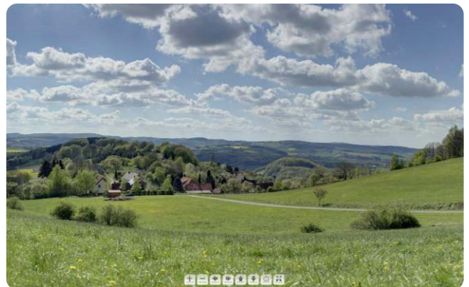
Ausschnitt der interaktiven Panoramaaufnahme in Rott

Die Erstellung einer Internetseite für die schönsten nordlippischen Wanderwege macht Fortschritte. Das mit der Entwicklung der Internetseite beauftragte Büro Digital Park aus Lage hat bereits die Grundstruktur der neuen Internetpräsenz fertiggestellt und die erste Serie interaktiver Panoramaaufnahmen erstellt. An acht herausragenden Aussichtspunkten in Nordlippe wurden die Panoramaaufnahmen zu Zeiten der Rapsblüte erstellt. Es folgen weitere Aufnahmen im Herbst und Winter. Die Winteraufnahmen sollten eigentlich bereits vorliegen, jedoch musste dieser Projektbaustein mangels Schnee leider verschoben werden. Eine Freischaltung der Internetseite soll in den kommenden Monaten erfolgen.